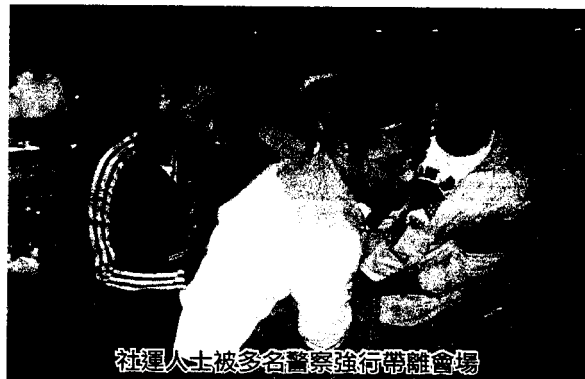
社運人士被多名警察強行帶離會場

他說：「我再講一次：你是不能留在這裡的。」記者問：「我不離開，是否要抬我離場？」新聞局人員回應：「這樣我不擔保，由其他工作人員處理。」