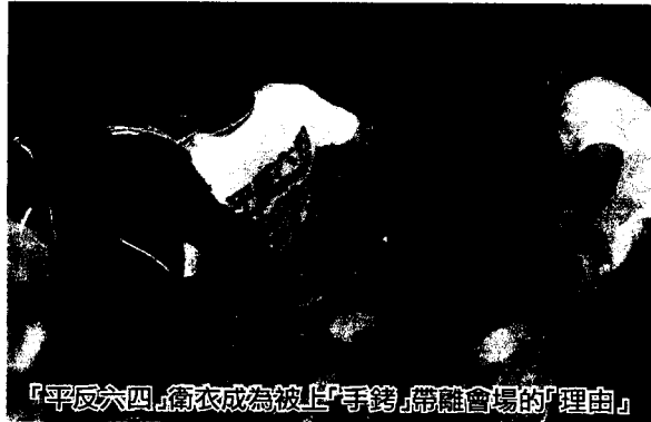
「平反六四」衛衣成為被上「手銬」帶離會場的「理由」