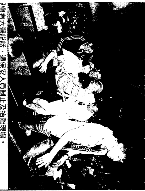
會者大聲說話，遭保安人員制止及抬離現場。

與會市民林先生斥責，澳門人是否個個都盲了？主持只說秩序混亂便要人離場，澳門是否連少數聲音也容不下？而大多支持「主流民意」者亦是說一套，不尊重其他人發言。他又稱，發言者中不乏教育界人士，但他們只會教導學生順從別人意見，沒有自己想法，當聽到有人持反對意見時，便帶頭侮辱他人。他認為，現時澳門青年人不知公義，只懂吃喝玩樂。他不明白為何澳門會出現如斯情況。 另外，有記者在現場採訪時遭阻止，亦有記者攝影時被新聞局公關限制採訪範圍。 記者不滿新聞局妨礙新聞自由。新聞局局長陳致平回應時說：「無話唔男人採訪，唔影響咪得囉！但（新聞局公關）覺得有問題，大家咪就一就好唔好呀！」他又表示，任何採訪須遵守大會的秩序，當局按大會要求作出配合並安排傳媒採訪，希望發言者能順利發言，若要採訪可到場外。他強調調會向當局人員了解有關情況，不認為政府妨礙新聞自由。